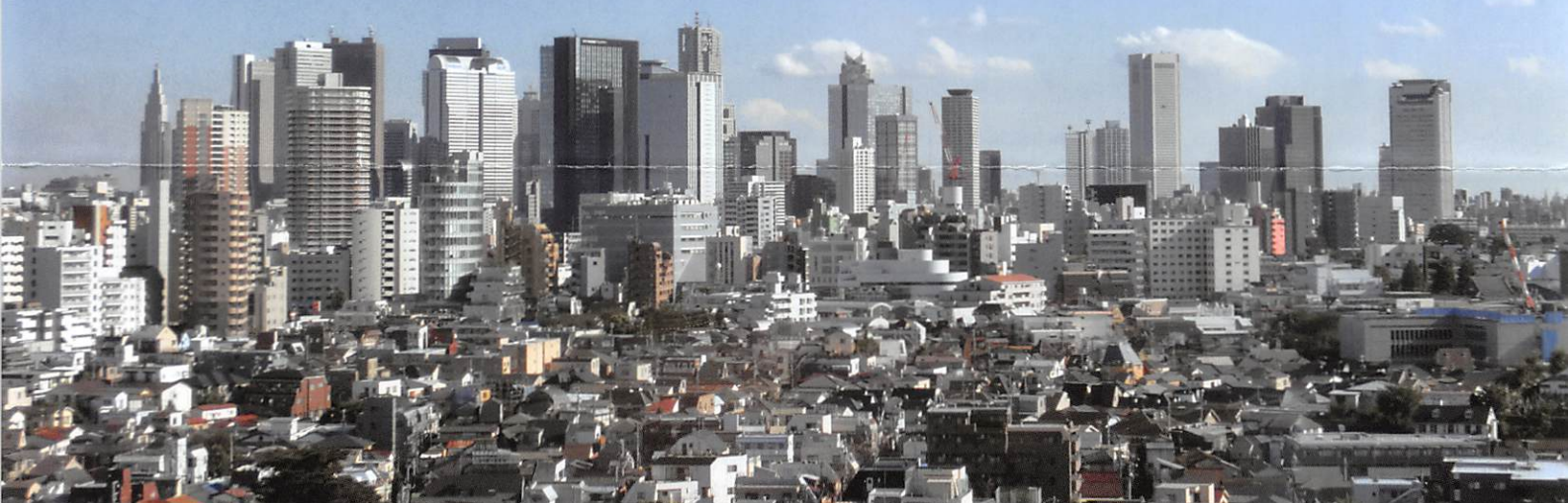
The view from Mejiro University Shinjuku Campus