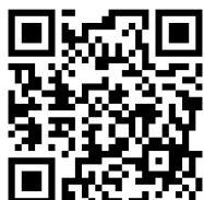
参加申込 QR コード